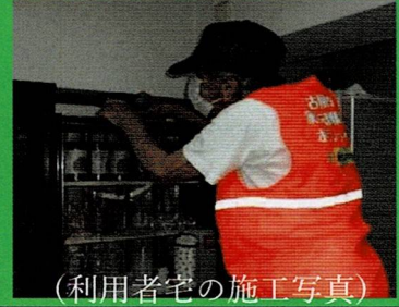
(利用者宅の施工写真)