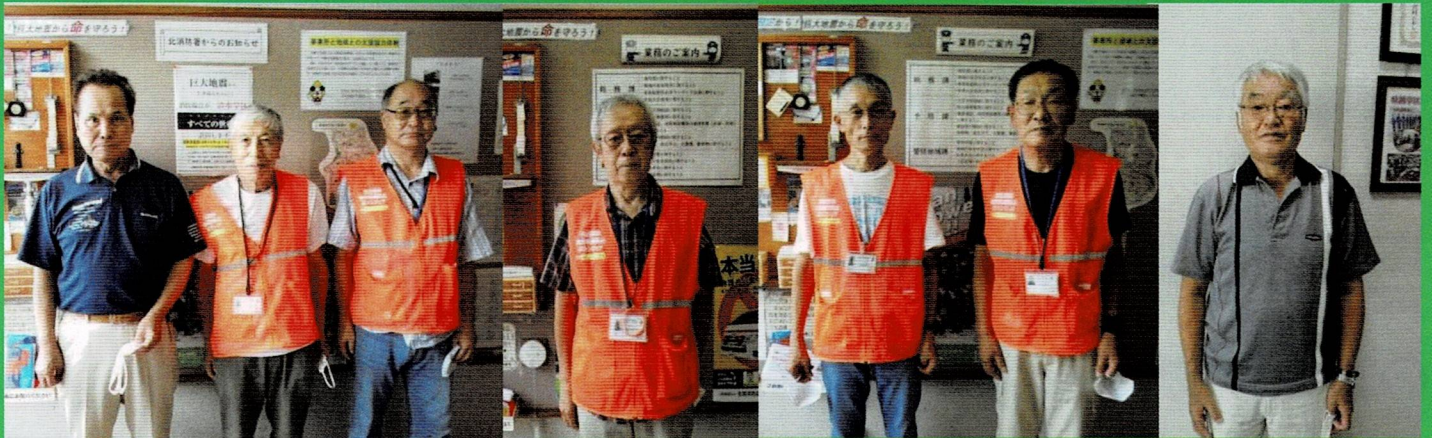
(他に12名の方が活躍中)